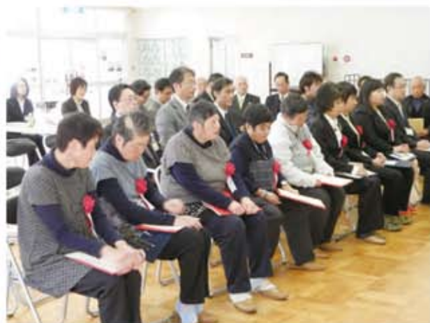
楽しくお仕事ができ、表彰も受けられてうれしいです。