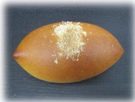
焼きカレーパン 140円