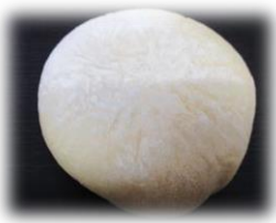
クリームチーズ 150円

オレンジピールの練り込んだ生地に、甘酸っぱいクリームチーズを包み、オレンジスライスにトッピングしました