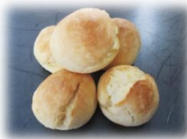
プレーンスコーン 5個入り 200円