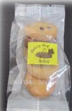
クッキー5種入り (5枚) 150円