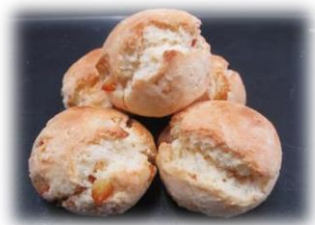
オレンジスコーン 5個入り 250円