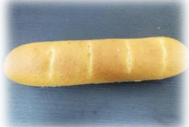
ミルクフランス 170円

ミルク風味のペーストにカリフォ ルニア産レーズンを加えた、ラム 酒が香る風味豊かなクリームです