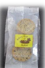
ごまクッキー (3枚) 100円