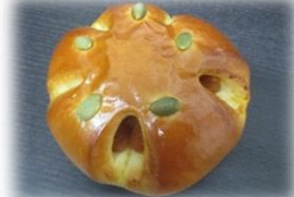
かぼちゃあんパン 140円