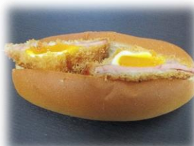
ハムカツとろたまパン 210円