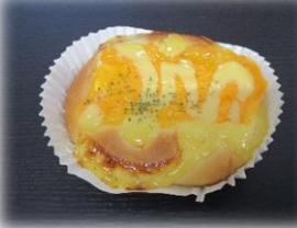
【濃い】チーズパン 170円

3種類（クリームチーズ、チェ ダー、チーズソース）のチーズが 絶妙にマッチ！！クセになりま す。