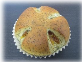
アールグレイ&杏ジャム 160円