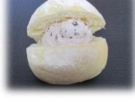
白パンあずきホイップ 140円