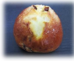
レーズンシュガー 110円