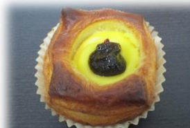
ブルーベリージャムカスター ドデニッシュ 170円

濃厚ブルーベリージャムにカス タードクリームえを、サクサクデ ニッシュ生地に合わせました。