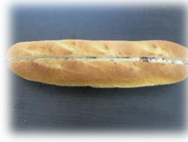
ラムレーズンフランス 150円

ミルク風味のペーストにカリフォ ルニア産レーズンを加えた、ラム 酒が香る風味豊かなクリームです