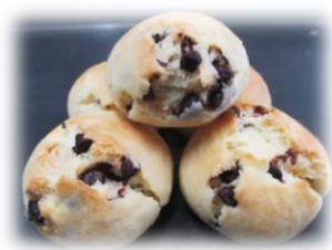
チョコチップスコーン 5個入り 250円