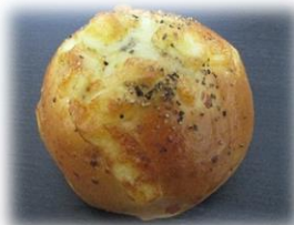
ブラックペッパーチーズパン 130円