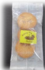
メープルクッキー (3枚) 100円