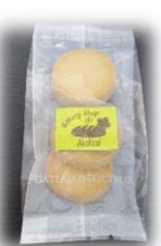
プレーンクッキー (3枚) 100円