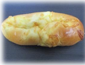
トマト&ハーブソースの ウインナーパン 180円

3種類（クリームチーズ、チェ ダー、チーズソース）のチーズが 絶妙にマッチ！！クセになりま す。