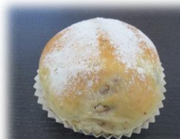
くるみレーズンチーズ&クリームチーズパン 180円

香豊かなアールグレイを練り込んだ生地、さわやかな甘さのミックスベリーを使用しました