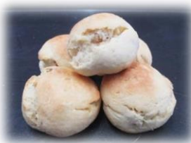
くるみスコーン5個入り 250円