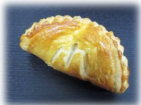
国産リンゴのアップルパイ 180円