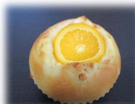
オレンジクリームチーズ 170円

オレンジピールの練り込んだ生地に、甘酸っぱいクリームチーズを包み、オレンジスライスにトッピングしました