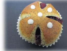
アールグレイ&ミックスベリー 160円

香豊かなアールグレイを練り込んだ生地、さわやかな甘さのミックスベリーを使用しました