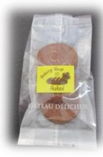
ココアクッキー (3枚) 100円