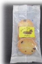
チョコチップクッキー (3枚) 100円