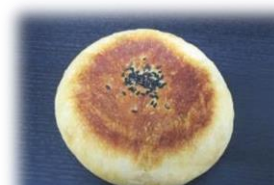
野沢菜のおやき 170円