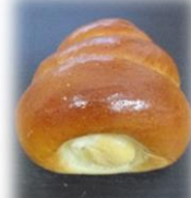
豆乳クリームコルネ 140円

岡山県産とよしろめ大豆をまる ごと使った濃密な豆乳を使用し た、クリーミーでコクのある優 しい味わいです