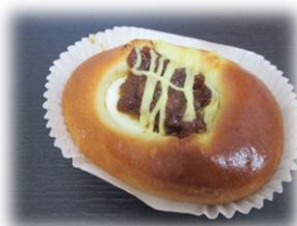
焼豚&たまごパン 160円

ゆで卵の上に、炭火風味の甘辛い焼豚 と筍をのせ、マヨネーズをトッピング 姉妹sた。