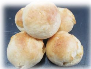
メープルスコーン 5個入り 200円