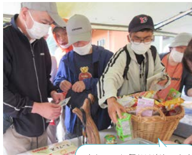
すかいのお祭りは楽しいね! みんなパリティ気分です