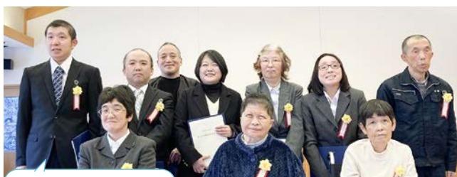
受賞されましたご利用者様