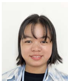
皇海荘 支援員 イ イ アウン

私の趣味は歌を歌うことです。仕事内容は、利用者さんの日常生活を手伝うことです。例えば入浴支援や食事介助、排泄介助などです。皇海荘の利用者さんと職員は家族のように仲がいいので働きやすいです。日本で3年間働いたら介護福祉士試験を受けるつもりです。