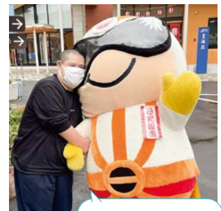
僕の方が男前でしょ〜