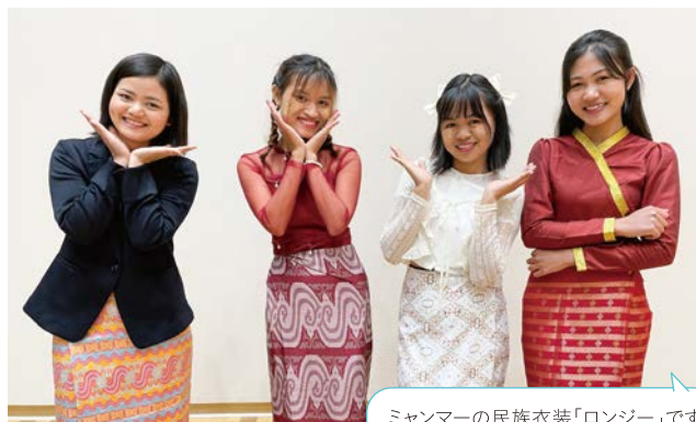
ミャンマーの民族衣装「ロンジー」です