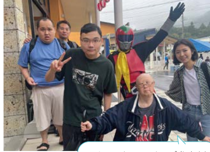
スクラムオールスターズ参上!! 打倒サザン