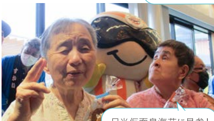
日光仮面皇海荘に見参！