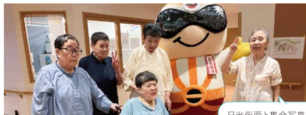
日光仮面と集合写真！