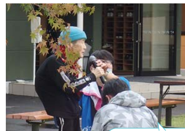
福祉まつりの開会を宣言します！！

中庭では「小さなサーカス団たらったらった」のお二人による本格的な大道芸に皆さん大興奮！ご利用者も参加されたジャグリングショーは見事に成功し、会場中が笑顔で包まれ熱気あふれる一日となりました。