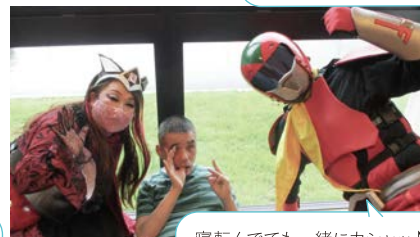
寝転んでも一緒にカシャッ♪