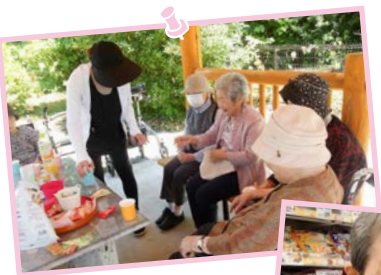
すかいの郷 こもれび

今回のテーマは、ロックフェス。ご利用者にカラオケを楽しんで頂きました。職員が結成した謎のバンドは大好評！施設の内外から様々な方にご来場いただき、大いに盛り上がりました。