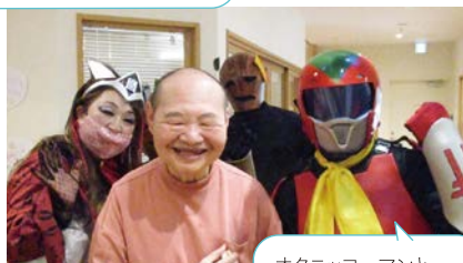
オクニッコーマンと悪役の方々と一緒に♪