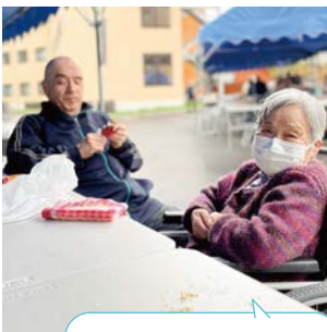
親子水入らず 楽しい時間は あつという間です