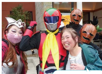
ヒーローのおかげで 福祉まつりも安全です!