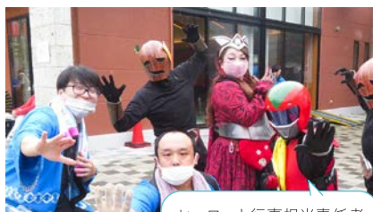
ヒーローと行事担当責任者