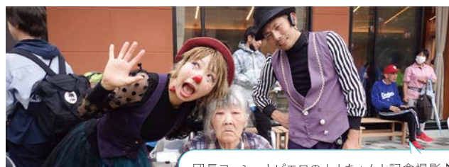
団長ヨッシーとピエロのナナちゃんと記念撮影♪