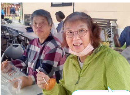
手づくりお稲荷さん 美味しかったです