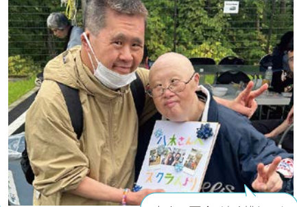
久々の再会、遠く離れても ずっともだち