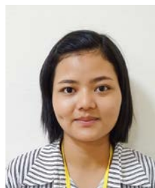
第二皇海荘 支援員 ヌ ヌ カイン

私の趣味は歌を歌うことです。仕事内容は、利用者さんの日常生活を手伝うことです。例えば入浴支援や食事介助、排泄介助などです。皇海荘の利用者さんと職員は家族のように仲がいいので働きやすいです。日本で3年間働いたら介護福祉士試験を受けるつもりです。