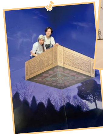
スクラム あらかわ

受託作業でろばた漬けのたまりチーズの梱包作業を行っています。失敗しないよう慎重に作業を行い出荷しています。