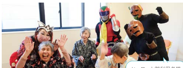
ヒーローと御利用者様