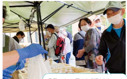
足尾のパン工房は大盛況! 来年は ご利用者も販売で参加できると良いな