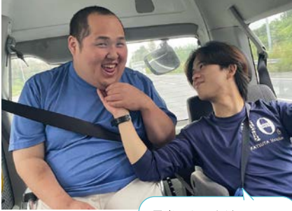
日光へおでかけ ニッコリ 笑顔かがやいて