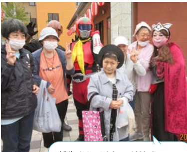
新生すかいはキレイだね! 懐かしい顔にも会えて楽しかった