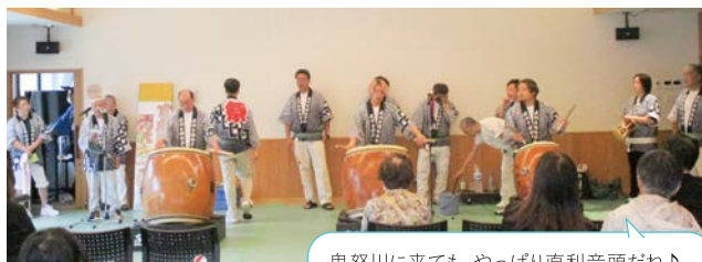
鬼怒川に来てても、やっぱり直利音頭だね♪