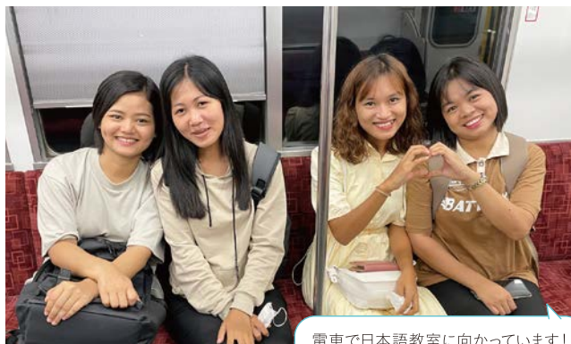
電車で日本語教室に向かっています！

日本に来た時は秋でした。秋は紅葉がとても綺麗です。これから日本の四季折々の景色を見るのがとても楽しみです。日本に来て仕事を始める時が心配でしたが、入居者様も先輩も優しいので今では仕事がとても楽しいです。